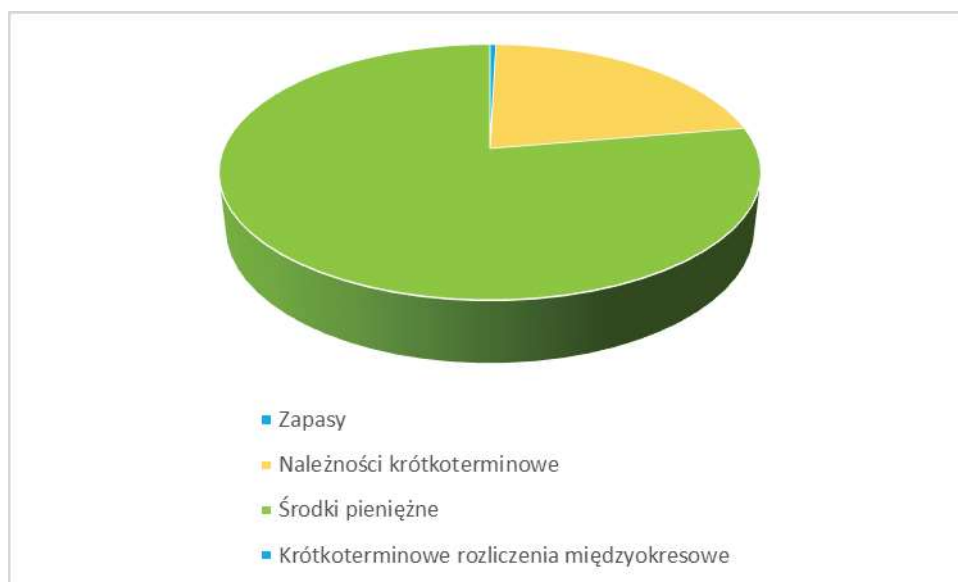
Rysunek 2. Podział aktywów obrotowych

Podział aktywów obrotowych przedstawia poniższy rysunek.