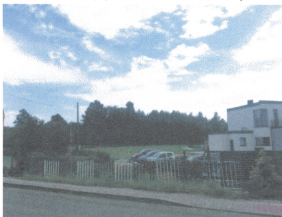
Widok od strony północnej