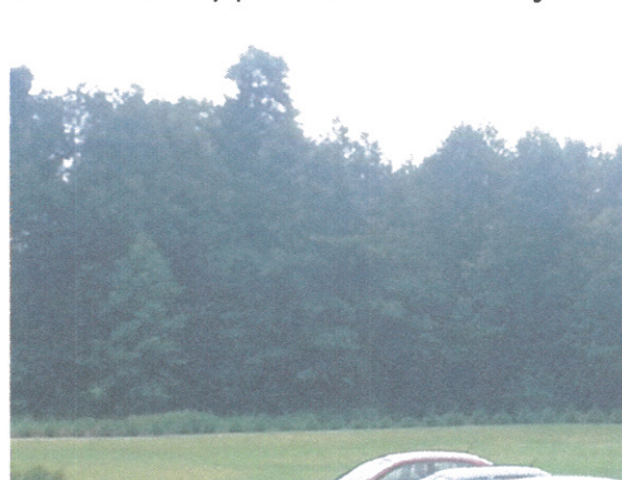
Widok od strony północnej