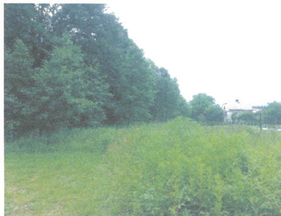
Widok od strony południowo-wschodniej