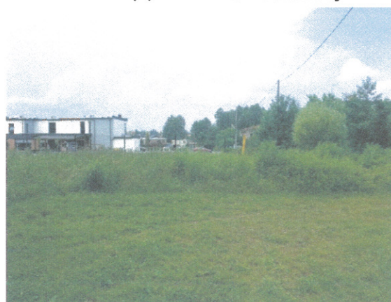
Widok od strony południowo-wschodniej