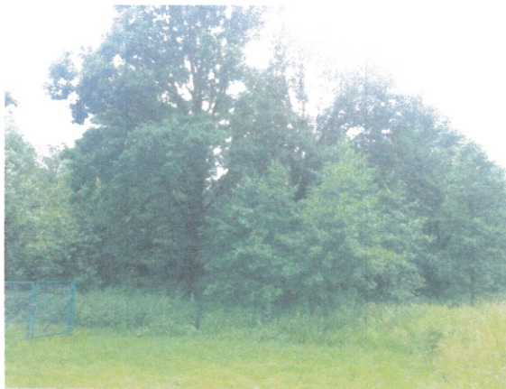
Widok od strony południowej