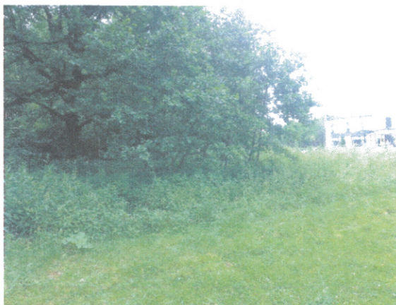
Widok od strony południowo-wschodniej